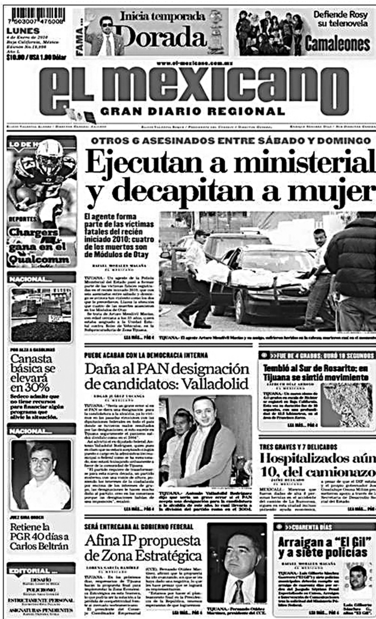
IMAGEN 2. PORTADA ESTÁNDAR DEL PERIÓDICO GENERALISTA EL MEXICANO , LUNES 4 DE ENERO DE 2010. EN LA PRIMERA PÁGINA SE COLOCA EL ANTEÍTULO, TÍTULO, SUMARIO Y DOS O TRES PÁRRAFOS DE LA NOTICIA, MIENTRAS QUE LA INFORMACIÓN COMPLETA SE UBICA EN LA PÁGINA 3A DE LA SECCIÓN ESTATAL, Y PUEDE ABARCAR HASTA 15 PÁRRAFOS.